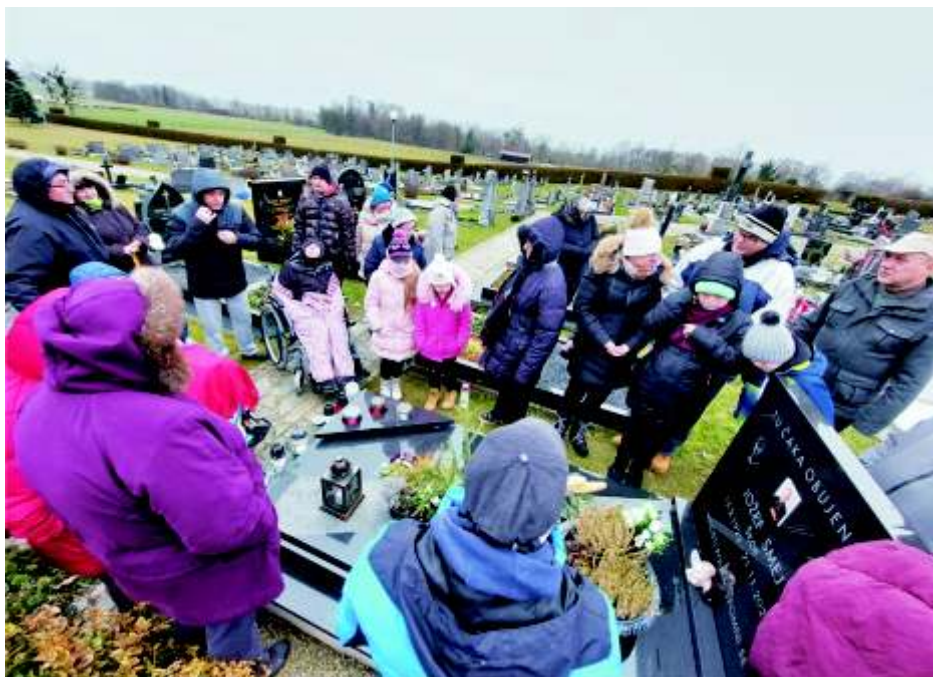
Poklon srčnemu lučkarskemu škofu Smeju