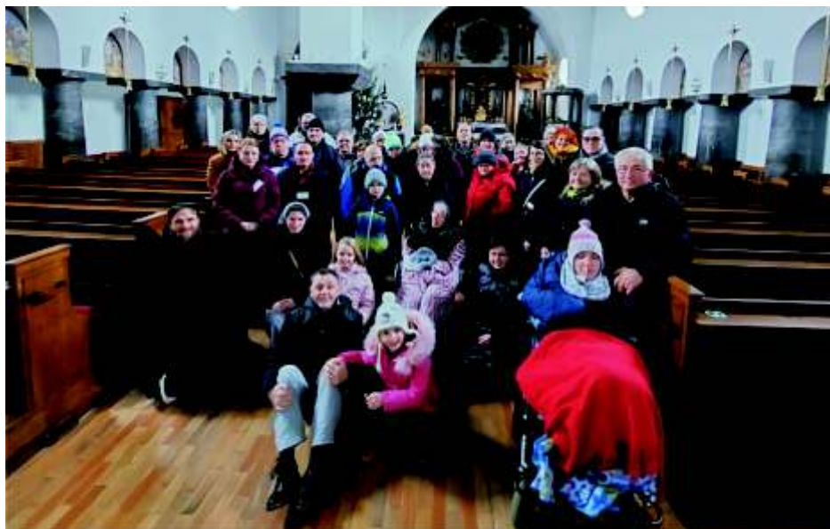
Romanje v Bogojino